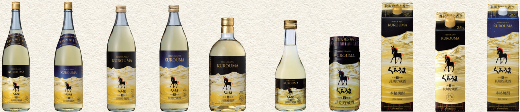
757 長期貯蔵酒 ひむかのくろうま 759 長期貯蔵酒 ひむかのくろうま 761 長期貯蔵酒 ひむかのくろうま 763 長期貯蔵酒 ひむかのくろうま 797 長期貯蔵酒 ひむかのくろうま 625 長期貯蔵酒 ひむかのくろうま 626 長期貯蔵酒 ひむかのくろうまカップ 768 長期貯蔵酒 ひむかのくろうまバック 762 長期貯蔵酒 ひむかのくろうまバック 758 長期貯蔵酒 ひむかのくろうまバック