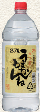
256 麦うまかもんねペット