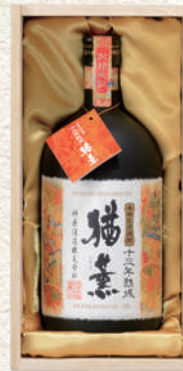
889 猫薫 なおしげ