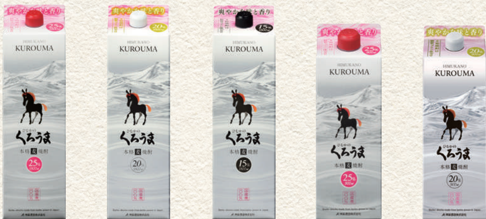
213 ひむかのくろうまパック 231 ひむかのくろうまパック 265 ひむかのくろうまパック 288 ひむかのくろうまスリムパック 290 ひむかのくろうまスリムパック