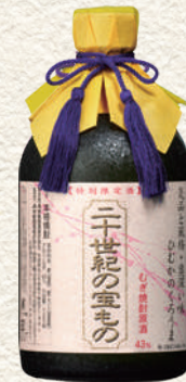
247 二十世紀の宝もの