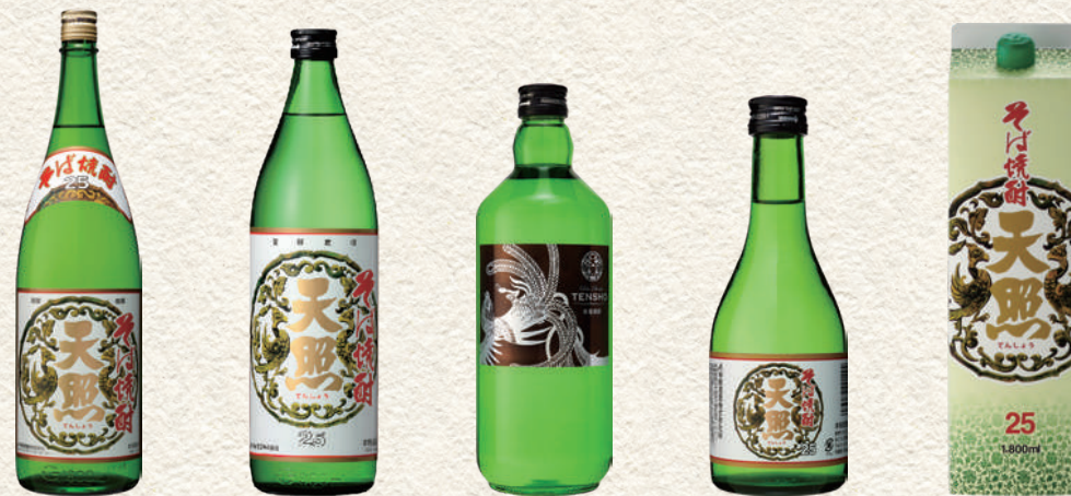
178 そば天照 180 そば天照 182 そば天照 183 そば天照 179 そば天照パック