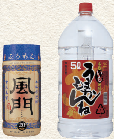
590 宮崎限定 風門 マイカップ 522 茅うまかもんねペット