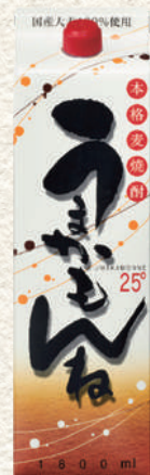
255 麦うまかもんねパック