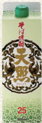
181 そば天照スリムパック