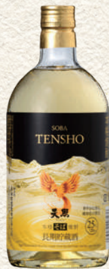
723 長期貯蔵酒 そば天照