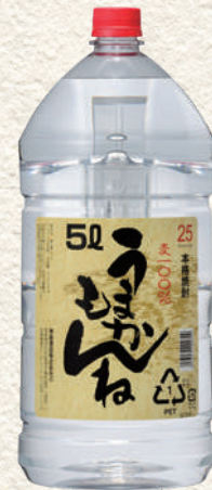
272 麦うまかもんねペット