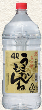
257 麦うまかもんねペット