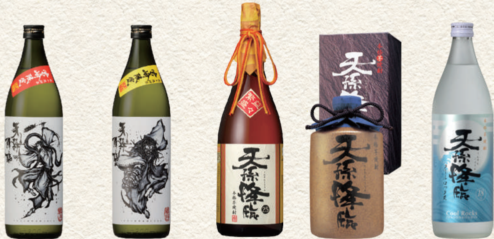
502 宮崎限定 天孫降臨 女舞 501 宮崎限定 天孫降臨 男舞 528 天孫降臨 549 天孫降臨 陶器 567 クールロック天孫降臨