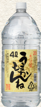
260 麦うまかもんねペット