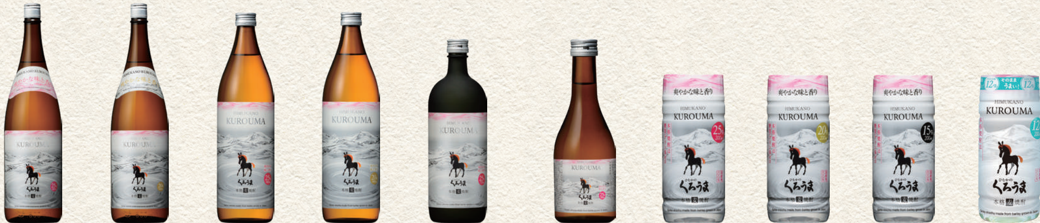
239 ひむかのくろうま 241 ひむかのくろうま 226 ひむかのくろうま 227 ひむかのくろうま 203 ひむかのくろうま