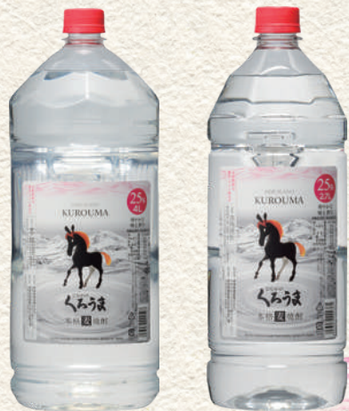
250 ひむかのくろうまペット 236 ひむかのくろうまペット