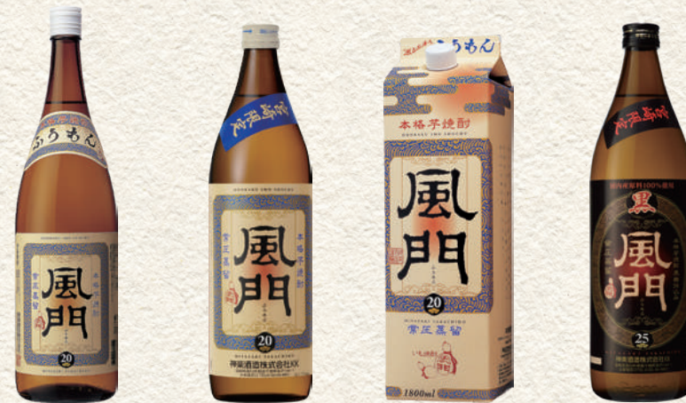
591 宮崎限定 風門 592 宮崎限定 風門 593 宮崎限定 風門パック 595 宮崎限定 風門 黒麴